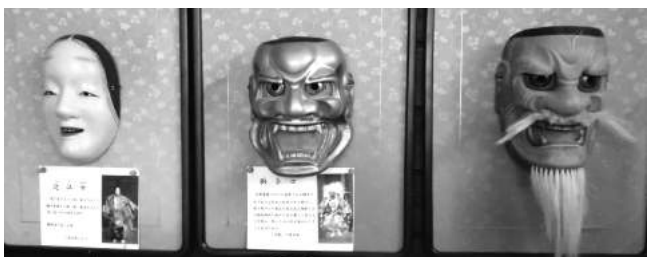
自宅隣の工房「元匠塾」に飾られた能面

昨年、指導を受けている会から「敏元」の彫名(雅号)を許状され、自宅隣の工房を「元匠塾」として掲げた。そして「いつか能楽師に自分の打った面で舞ってもらおうのが、能面打ちとしての夢です」と言う。(取材=R)